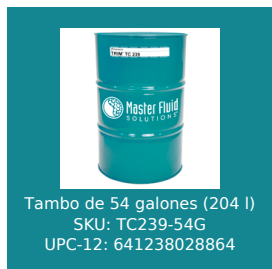
Tambo de 54 galones (204 l) SKU: TC239-54G UPC-12: 641238028864