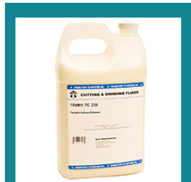
Cubeta de 1 galones (3.7 l) SKU: TC239-1G UPC-12: 641238074342