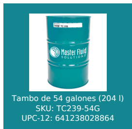
Tambo de 54 galones (204 l) SKU: TC239-54G UPC-12: 641238028864