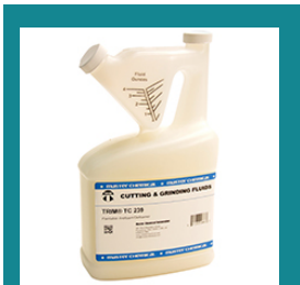
Punta de 2 cuartos de medida "N" ® SKU: TC239-2Q UPC-12: 641238028833