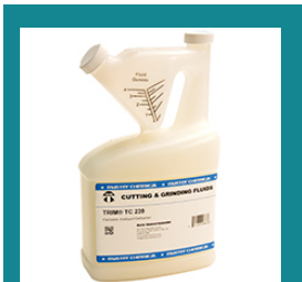
Punta de 2 cuartos de medida "N" ® SKU: TC239-2Q UPC-12: 641238028833