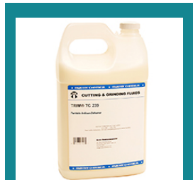
Cubeta de 1 galones (3.7 l) SKU: TC239-1G UPC-12: 641238074342