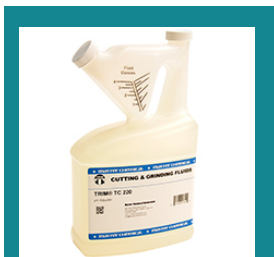
Punta de 2 cuartos de medida "N" ® SKU: TC220-2Q UPC-12: 641238018094