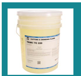
Cubeta de 5 galones (19 l) SKU: TC220-5G UPC-12: 641238011439