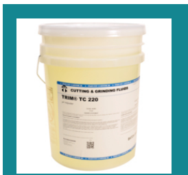
Cubeta de 5 galones (19 l) SKU: TC220-5G UPC-12: 641238011439