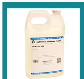
Cubeta de 1 galones (3.7 l) SKU: TC220-1G UPC-12: 641238074328