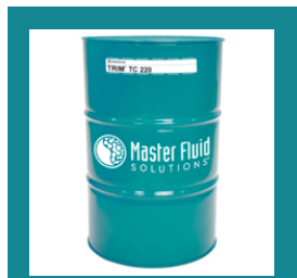
Tambo de 54 galones (204 l) SKU: TC220-54G UPC-12: 641238011446