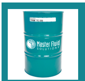
Tambo de 54 galones (204 l) SKU: TC220-54G UPC-12: 641238011446