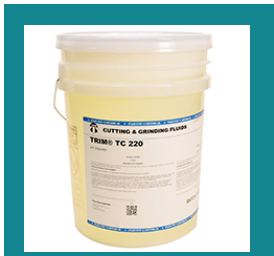
Cubeta de 5 galones (19 l) SKU: TC220-5G UPC-12: 641238011439