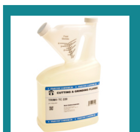
Punta de 2 cuartos de medida "N" ® SKU: TC220-2Q UPC-12: 641238018094