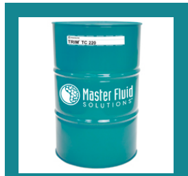
Tambo de 54 galones (204 l) SKU: TC220-54G UPC-12: 641238011446