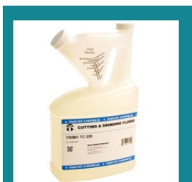
Punta de 2 cuartos de medida "N" ® SKU: TC220-2Q UPC-12: 641238018094