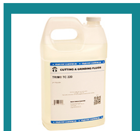
Cubeta de 1 galones (3.7 l) SKU: TC220-1G UPC-12: 641238074328