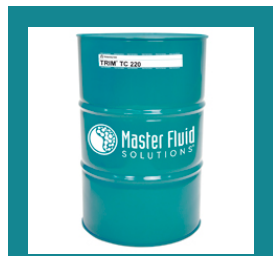
Tambo de 54 galones (204 l) SKU: TC220-54G UPC-12: 641238011446