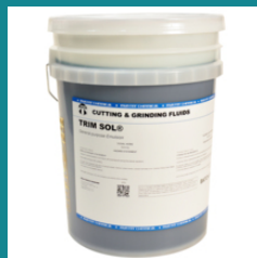
Cubeta de 5 galones (19 l) SKU: SOL-5G UPC-12: 641238008392