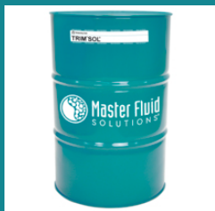
Tambo de 54 galones (204 l) SKU: SOL-54G UPC-12: 641238008408