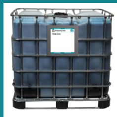
Contenedor tipo bolsa de 270 galones (1022 l) SKU: SOL-270G UPC-12: 641238034216

Es posible que se haya utilizado DeepL para traducir parte de esta hoja de datos. Si observa algún error, por favor, háganoslo saber: webmaster4mfs@gmail.com