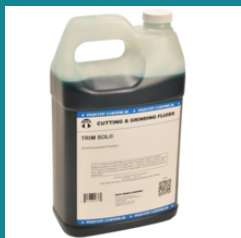
Cubeta de 1 galones (3.7 l) SKU: SOL-1G UPC-12: 641238008361