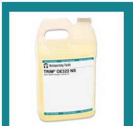
Cubeta de 1 galones (3.7 l) SKU: OE322NS-1G UPC-12: 641238077596