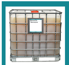
Contenedor tipo bolsa de 270 galones (1022 l) SKU: OE322NS-270G UPC-12: 641238077619