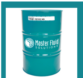
Tambo de 54 galones (204 l) SKU: OE322NS-54G UPC-12: 641238076643