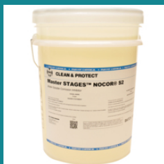
Cubeta de 5 galones (19 l) SKU: NOCORS2-5G UPC-12: 641238042235