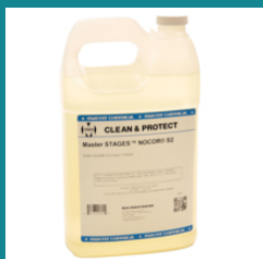
Cubeta de 1 galones (3.7 l) SKU: NOCORS2-1G UPC-12: 641238043010