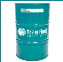
Tambo de 54 galones (204 l) SKU: NOCORS2-54G UPC-12: 641238042242