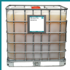
Contenedor tipo bolsa de 270 galones (1022 l) SKU: NOCORS2-270G UPC-12: 641238042273

Es posible que se haya utilizado DeepL para traducir parte de esta hoja de datos. Si observa algún error, por favor, háganoslo saber: webmaster4mfs@gmail.com