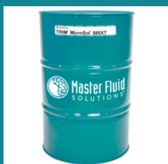
Tambo de 54 galones (204 l) SKU: MS585XT-54G UPC-12: 641238065814