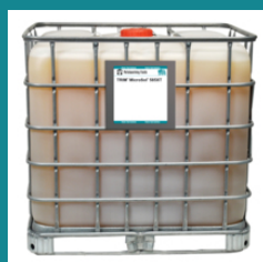
Contenedor tipo bolsa de 270 galones (1022 l) SKU: MS585XT-270G UPC-12: 641238065852