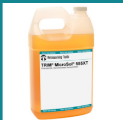
Cubeta de 1 galones (3.7 l) SKU: MS585XT-1G UPC-12: 641238065838