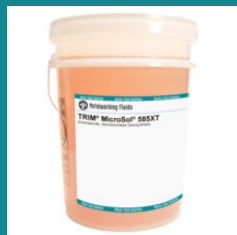
Cubeta de 5 galones (19 l) SKU: MS585XT-5G UPC-12: 641238065821