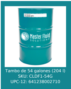
Tambo de 54 galones (204 l) SKU: CLDF1-54G UPC-12: 641238002710