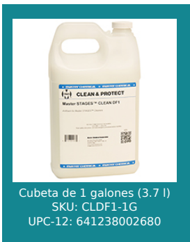
Cubeta de 1 galones (3.7 l) SKU: CLDF1-1G UPC-12: 641238002680