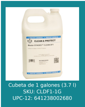
Cubeta de 1 galones (3.7 l) SKU: CLDF1-1G UPC-12: 641238002680