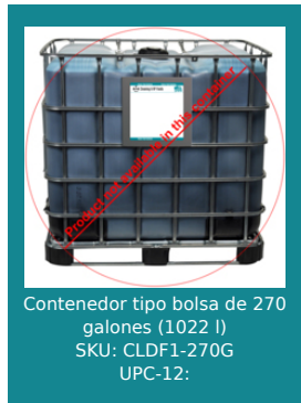
Contenedor tipo bolsa de 270 galones (1022 l) SKU: CLDF1-270G UPC-12: