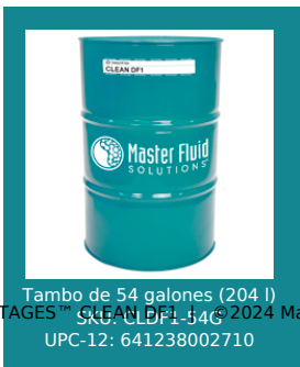
Tambo de 54 galones (204 l) SKU: CLDF1-54G UPC-12: 641238002710