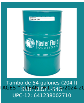
Tambo de 54 galones (204 l) SKU: CLDF1-54G UPC-12: 641238002710