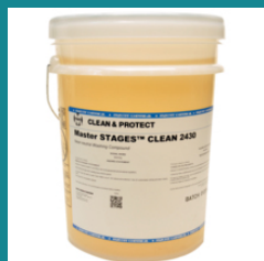
Cubeta de 5 galones (19 l) SKU: CL2430-5G UPC-12: 641238041801