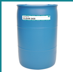
Tambo de 54 galones (204 l) SKU: CL2430-54G UPC-12: 641238041818