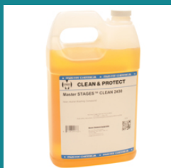
Cubeta de 1 galones (3.7 l) SKU: CL2430-1G UPC-12: 641238041788