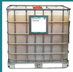
Contenedor tipo bolsa de 270 galones (1022 l) SKU: CL2430-270G UPC-12: 641238041849

Es posible que se haya utilizado DeepL para traducir parte de esta hoja de datos. Si observa algún error, por favor, háganoslo saber: webmaster4mfs@gmail.com