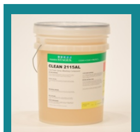
Cubeta de 5 galones (19 l) SKU: CL2115AL-5G UPC-12: 641238040545