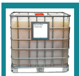
Contenedor tipo bolsa de 270 galones (1022 l) SKU: CL2115AL-270G UPC-12: 641238040583

Es posible que se haya utilizado DeepL para traducir parte de esta hoja de datos. Si observa algún error, por favor, háganoslo saber: webmaster4mfs@gmail.com