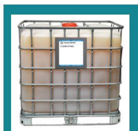
Contenedor tipo bolsa de 270 galones (1022 l) SKU: CL2115AL-270G UPC-12: 641238040583

Es posible que se haya utilizado DeepL para traducir parte de esta hoja de datos. Si observa algún error, por favor, háganoslo saber: webmaster4mfs@gmail.com