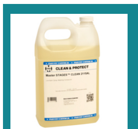
Cubeta de 1 galones (3.7 l) SKU: CL2115AL-1G UPC-12: 641238040521