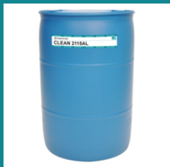
Tambo de 54 galones (204 l) SKU: CL2115AL-54G UPC-12: 641238040569