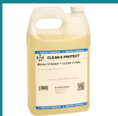
Cubeta de 1 galones (3.7 l) SKU: CL2115AL-1G UPC-12: 641238040521