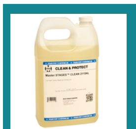
Cubeta de 1 galones (3.7 l) SKU: CL2115AL-1G UPC-12: 641238040521