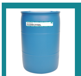
Tambo de 54 galones (204 l) SKU: CL2115AL-54G UPC-12: 641238040569