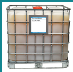
Contenedor tipo bolsa de 270 galones (1022 l) SKU: CL2115AL-270G UPC-12: 641238040583

Es posible que se haya utilizado DeepL para traducir parte de esta hoja de datos. Si observa algún error, por favor, háganoslo saber: webmaster4mfs@gmail.com