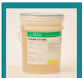
Cubeta de 5 galones (19 l) SKU: CL2115AL-5G UPC-12: 641238040545