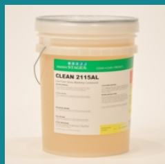
Cubeta de 5 galones (19 l) SKU: CL2115AL-5G UPC-12: 641238040545