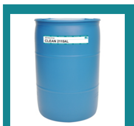
Tambo de 54 galones (204 l) SKU: CL2115AL-54G UPC-12: 641238040569