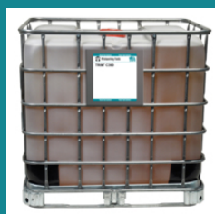
Contenedor tipo bolsa de 270 galones (1022 l) SKU: C390-270G UPC-12: 641238075752

Es posible que se haya utilizado DeepL para traducir parte de esta hoja de datos. Si observa algún error, por favor, háganoslo saber: webmaster4mfs@gmail.com