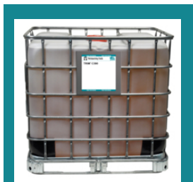
Contenedor tipo bolsa de 270 galones (1022 l) SKU: C390-270G UPC-12: 641238075752

Es posible que se haya utilizado DeepL para traducir parte de esta hoja de datos. Si observa algún error, por favor, háganoslo saber: webmaster4mfs@gmail.com