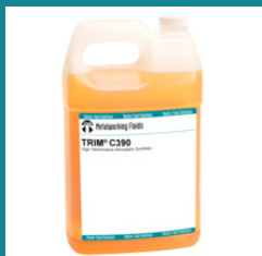
Cubeta de 1 galones (3.7 l) SKU: C390-1G UPC-12: 641238075783