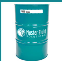
Tambo de 54 galones (204 l) SKU: C390-54G UPC-12: 641238075738