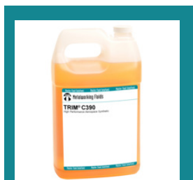
Cubeta de 1 galones (3.7 l) SKU: C390-1G UPC-12: 641238075783