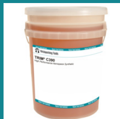
Cubeta de 5 galones (19 l) SKU: C390-5G UPC-12: 641238075745