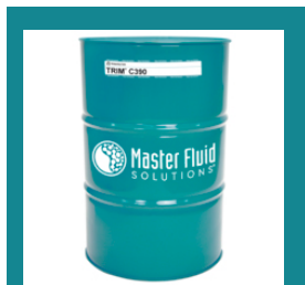
Tambo de 54 galones (204 l) SKU: C390-54G UPC-12: 641238075738