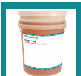
Cubeta de 5 galones (19 l) SKU: C390-5G UPC-12: 641238075745