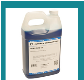
Cubeta de 1 galones (3.7 l) SKU: C270BD-1G UPC-12: 641238066743