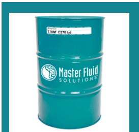
Tambo de 54 galones (204 l) SKU: C270BD-54G UPC-12: 641238001317