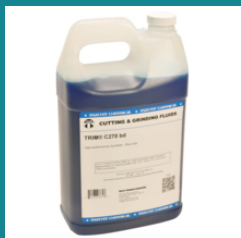
Cubeta de 1 galones (3.7 l) SKU: C270BD-1G UPC-12: 641238066743