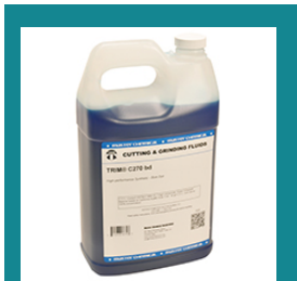
Cubeta de 1 galones (3.7 l) SKU: C270BD-1G UPC-12: 641238066743