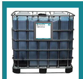
Contenedor tipo bolsa de 270 galones (1022 l) SKU: C270BD-270G UPC-12: 641238034018