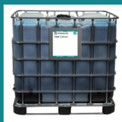
Contenedor tipo bolsa de 270 galones (1022 l) SKU: C270BD-270G UPC-12: 641238034018