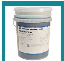
Cubeta de 5 galones (19 l) SKU: C270BD-5G UPC-12: 641238001300