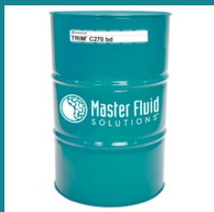
Tambo de 54 galones (204 l) SKU: C270BD-54G UPC-12: 641238001317