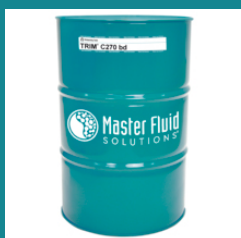
Tambo de 54 galones (204 l) SKU: C270BD-54G UPC-12: 641238001317