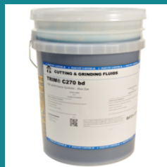
Cubeta de 5 galones (19 l) SKU: C270BD-5G UPC-12: 641238001300