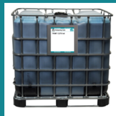
Contenedor tipo bolsa de 270 galones (1022 l) SKU: C270BD-270G UPC-12: 641238034018

Es posible que se haya utilizado DeepL para traducir parte de esta hoja de datos. Si observa algún error, por favor, háganoslo saber: webmaster4mfs@gmail.com