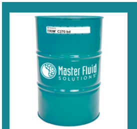
Tambo de 54 galones (204 l) SKU: C270BD-54G UPC-12: 641238001317