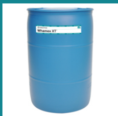
Fût de 54 gallons (204 l) SKU: WHMXXT-54G UPC-12: 641238069393