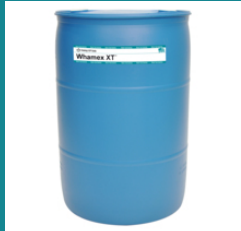
Fût de 54 gallons (204 l) SKU: WHMXXT-54G UPC-12: 641238069393