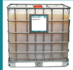
Cuve de 270 gallons (1022 l) SKU: WHMXXT-270G UPC-12: 641238070771

DeepL a peut-être été utilisé pour traduire certaines parties de cette fiche technique. N'hésitez pas à nous signaler toute erreur à corriger : webmaster4mfs@gmail.com