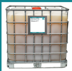
Cuve de 270 gallons (1022 l) SKU: WHMXXT-270G UPC-12: 641238070771