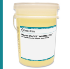
Seau de 5 gallons (19 l) SKU: WHMXXT-5G UPC-12: 641238069409