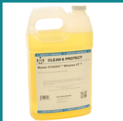
Bidon de 1 gallon (3,8 l) SKU: WHMXXT-1G UPC-12: 641238069416