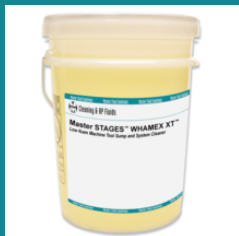
Seau de 5 gallons (19 l) SKU: WHMXXT-5G UPC-12: 641238069409