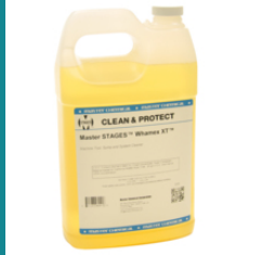
Bidon de 1 gallon (3,8 l) SKU: WHMXXT-1G UPC-12: 641238069416