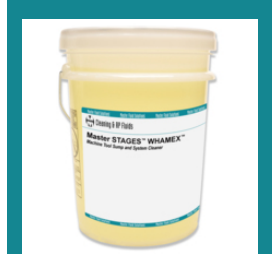
Seau de 5 gallons (19 l) SKU: WHAMEX-5G UPC-12: 641238027317