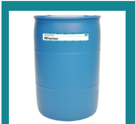
Fût de 54 gallons (204 l) SKU: WHAMEX-54G UPC-12: 641238027324