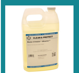
Bidon de 1 gallon (3,8 l) SKU: WHAMEX-1G UPC-12: 641238027294