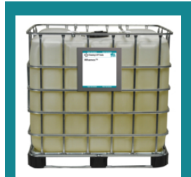
Cuve de 270 gallons (1022 l) SKU: WHAMEX-270G UPC-12: 641238033165

DeepL a peut-être été utilisé pour traduire certaines parties de cette fiche technique. N'hésitez pas à nous signaler toute erreur à corriger : webmaster4mfs@gmail.com