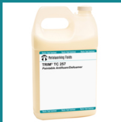
Bidon de 1 gallon (3,8 l) SKU: TC257-1G UPC-12: 641238083078