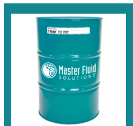
Fût de 54 gallons (204 l) SKU: TC257-54G UPC-12: 641238083122