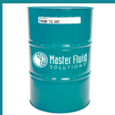
Fût de 54 gallons (204 l) SKU: TC257-54G UPC-12: 641238083122