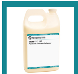
Bidon de 1 gallon (3,8 l) SKU: TC257-1G UPC-12: 641238083078