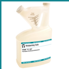
Facon Tip "N" Measure® de 2 pintes (1,9 l) SKU: TC257-2Q UPC-12: 641238083108