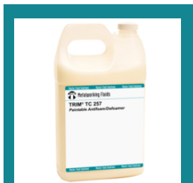
Bidon de 1 gallon (3,8 l) SKU: TC257-1G UPC-12: 641238083078