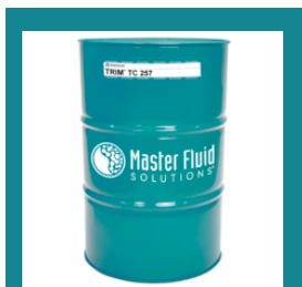
Fût de 54 gallons (204 l) SKU: TC257-54G UPC-12: 641238083122