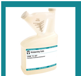
Flacon Tip "N" Measure ® de 2 pintes (1,9 l) SKU: TC257-2Q UPC-12: 641238083108