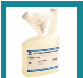
Facon Tip "N" Measure ® de 2 pintes (1,9 l) SKU: TC220-2Q UPC-12: 641238018094