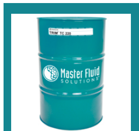
Fût de 54 gallons (204 l) SKU: TC220-54G UPC-12: 641238011446