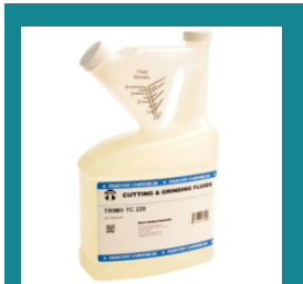
Flacon Tip "N" Measure ® de 2 pintes (1,9 l) SKU: TC220-2Q UPC-12: 641238018094