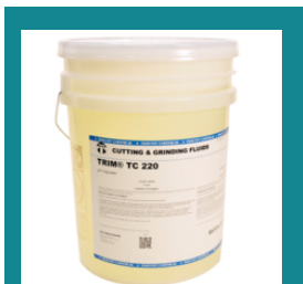
Seau de 5 gallons (19 l) SKU: TC220-5G UPC-12: 641238011439