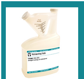
Flacon Tip "N" Measure ® de 2 pintes (1,9 l) SKU: TC211-2Q UPC-12: 641238074144