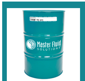
Fût de 54 gallons (204 l) SKU: TC211-54G UPC-12: 641238010944