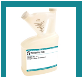
Flacon Tip "N" Measure ® de 2 pintes (1,9 l) SKU: TC211-2Q UPC-12: 641238074144