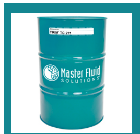
Fût de 54 gallons (204 l) SKU: TC211-54G UPC-12: 641238010944