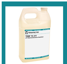
Bidon de 1 gallon (3,8 l) SKU: TC211-1G UPC-12: 641238032281