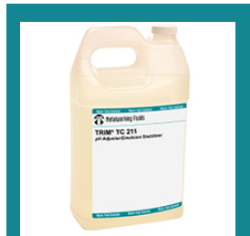
Bidon de 1 gallon (3,8 l) SKU: TC211-1G UPC-12: 641238032281