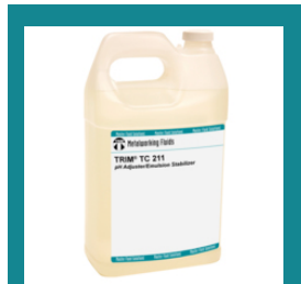
Bidon de 1 gallon (3,8 l) SKU: TC211-1G UPC-12: 641238032281