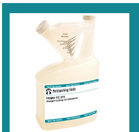
Flacon Tip "N" Measure ® de 2 pintes (1,9 l) SKU: TC211-2Q UPC-12: 641238074144