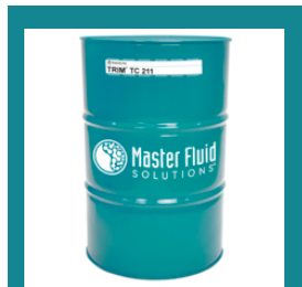
Fût de 54 gallons (204 l) SKU: TC211-54G UPC-12: 641238010944