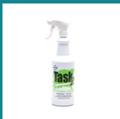
Flacon de 1 pinte (0,95 l) SKU: TASK2APC-OT UPC-12: 641238047407