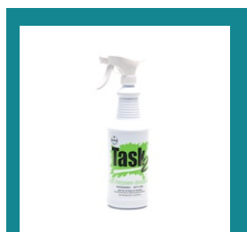
Flacon de 1 pinte (0,95 l) SKU: TASK2APC-OT UPC-12: 641238047407