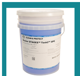
Seau de 5 gallons (19 l) SKU: TASK2APC-5G UPC-12: 641238000655