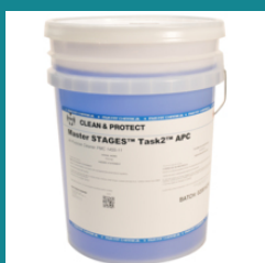
Seau de 5 gallons (19 l) SKU: TASK2APC-5G UPC-12: 641238000655