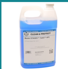
Bidon de 1 gallon (3,8 l) SKU: TASK2APC-1G UPC-12: 641238000617