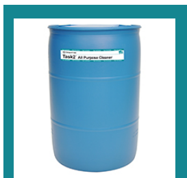
Fût de 54 gallons (204 l) SKU: TASK2APC-54G UPC-12: 641238047384

Master STAGES™ Task2™ APC | ©2008-2024 Master Fluid Solutions™ | 2024-12-03