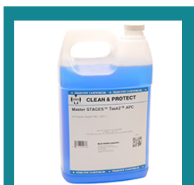
Bidon de 1 gallon (3,8 l) SKU: TASK2APC-1G UPC-12: 641238000617