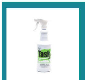
Flacon de 1 pinte (0,95 l) SKU: TASK2APC-OT UPC-12: 641238047407