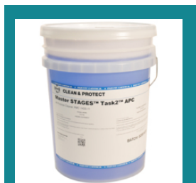
Seau de 5 gallons (19 l) SKU: TASK2APC-5G UPC-12: 641238000655