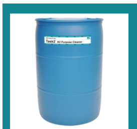
Fût de 54 gallons (204 l) SKU: TASK2APC-54G UPC-12: 641238047384

DeepL a peut-être été utilisé pour traduire certaines parties de cette fiche technique. N'hésitez pas à nous signaler toute erreur à corriger : webmaster4mfs@gmail.com