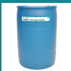
Fût de 54 gallons (204 l) SKU: TASK2APC-54G UPC-12: 641238047384

DeepL a peut-être été utilisé pour traduire certaines parties de cette fiche technique. N'hésitez pas à nous signaler toute erreur à corriger : webmaster4mfs@gmail.com