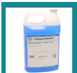
Bidon de 1 gallon (3,8 l) SKU: TASK2APC-1G UPC-12: 641238000617