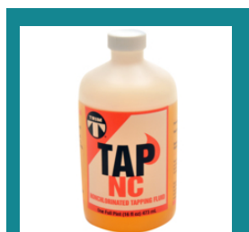
Flacon de 1 chopine (473 ml) SKU: TAPNC-1P UPC-12: 641238009429