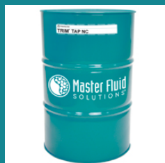
Fût de 54 gallons (204 l) SKU: TAPNC-54G UPC-12: 641238009399