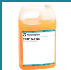
Bidon de 1 gallon (3,8 l) SKU: TAPNC-1G UPC-12: 641238009337