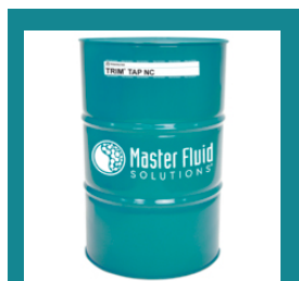
Fût de 54 gallons (204 l) SKU: TAPNC-54G UPC-12: 641238009399

DeepL a peut-être été utilisé pour traduire certaines parties de cette fiche technique. N'hésitez pas à nous signaler toute erreur à corriger : webmaster4mfs@gmail.com