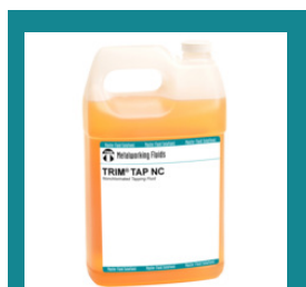
Bidon de 1 gallon (3,8 l) SKU: TAPNC-1G UPC-12: 641238009337