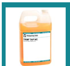
Bidon de 1 gallon (3,8 l) SKU: TAPNC-1G UPC-12: 641238009337