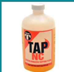
Flacon de 1 chopine (473 ml) SKU: TAPNC-1P UPC-12: 641238009429