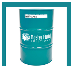
Fût de 54 gallons (204 l) SKU: TAPNC-54G UPC-12: 641238009399