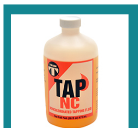
Flacon de 1 chopine (473 ml) SKU: TAPNC-1P UPC-12: 641238009429