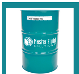
Fût de 54 gallons (204 l) SKU: OE322NS-54G UPC-12: 641238076643