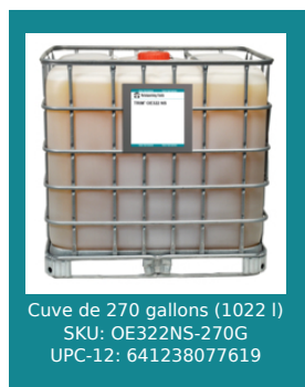
Cuve de 270 gallons (1022 l) SKU: OE322NS-270G UPC-12: 641238077619

DeepL a peut-être été utilisé pour traduire certaines parties de cette fiche technique. N'hésitez pas à nous signaler toute erreur à corriger : webmaster4mfs@gmail.com