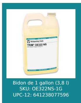
Bidon de 1 gallon (3,8 l) SKU: OE322NS-1G UPC-12: 641238077596