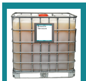
Cuve de 270 gallons (1022 l) SKU: OE322NS-270G UPC-12: 641238077619