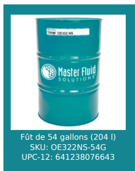
Fût de 54 gallons (204 l) SKU: OE322NS-54G UPC-12: 641238076643