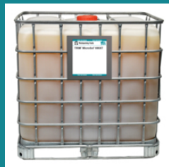
Cuve de 270 gallons (1022 l) SKU: MS690XT-270G UPC-12: 641238073017