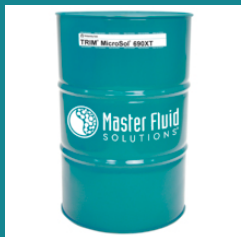
Fût de 54 gallons (204 l) SKU: MS690XT-54G UPC-12: 641238073000