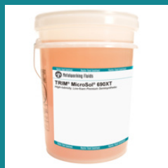
Seau de 5 gallons (19 l) SKU: MS690XT-5G UPC-12: 641238072997