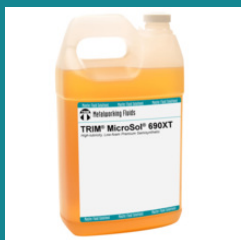
Bidon de 1 gallon (3,8 l) SKU: MS690XT-1G UPC-12: 641238072973