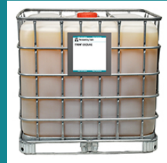
Cuve de 270 gallons (1022 l) SKU: E925AE-270G UPC-12: 641238077145