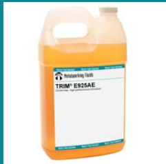
Bidon de 1 gallon (3,8 l) SKU: E925AE-1G UPC-12: 641238077121