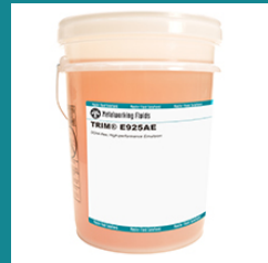
Seau de 5 gallons (19 l) SKU: E925AE-5G UPC-12: 641238077114