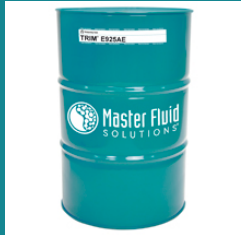
Fût de 54 gallons (204 l) SKU: E925AE-54G UPC-12: 641238077107