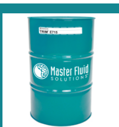
Fût de 54 gallons (204 l) SKU: E715-54G UPC-12: 641238081821