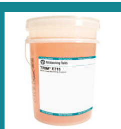
Seau de 5 gallons (19 l) SKU: E715-5G UPC-12: 641238081814