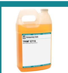
Bidon de 1 gallon (3,8 l) SKU: E715-1G UPC-12: 641238081791