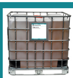
Cuve de 270 gallons (1022 l) SKU: E715-270G UPC-12: 641238081838

DeepL a peut-être été utilisé pour traduire certaines parties de cette fiche technique. N'hésitez pas à nous signaler toute erreur à corriger : webmaster4mfs@gmail.com