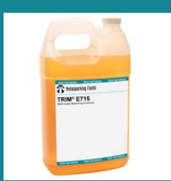
Bidon de 1 gallon (3,8 l) SKU: E715-1G UPC-12: 641238081791