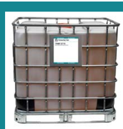
Cuve de 270 gallons (1022 l) SKU: E715-270G UPC-12: 641238081838