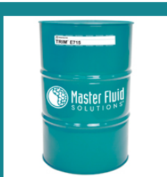
Fût de 54 gallons (204 l) SKU: E715-54G UPC-12: 641238081821