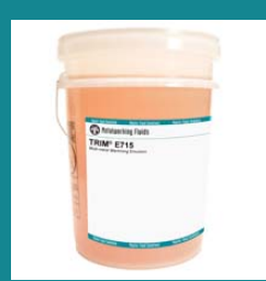
Seau de 5 gallons (19 l) SKU: E715-5G UPC-12: 641238081814