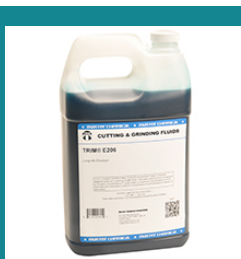
Bidon de 1 gallon (3,8 l) SKU: E206-1G UPC-12: 641238003052