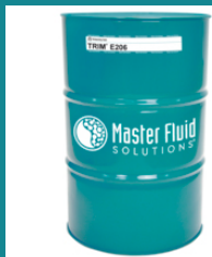
Fût de 54 gallons (204 l) SKU: E206-54G UPC-12: 641238003090