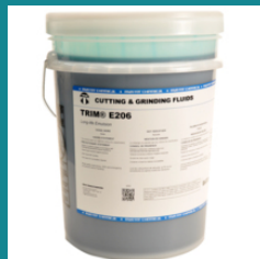
Seau de 5 gallons (19 l) SKU: E206-5G UPC-12: 641238003083