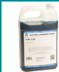
Bidon de 1 gallon (3,8 l) SKU: E206-1G UPC-12: 641238003052