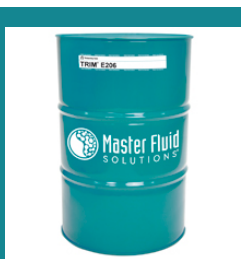
Fût de 54 gallons (204 l) SKU: E206-54G UPC-12: 641238003090