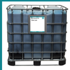
Cuve de 270 gallons (1022 l) SKU: E206-270G UPC-12: 641238033882

DeepL a peut-être été utilisé pour traduire certaines parties de cette fiche technique. N'hésitez pas à nous signaler toute erreur à corriger : webmaster4mfs@gmail.com