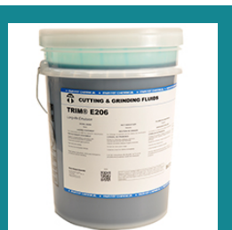
Seau de 5 gallons (19 l) SKU: E206-5G UPC-12: 641238003083