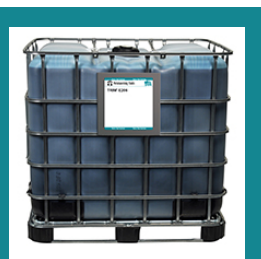
Cuve de 270 gallons (1022 l) SKU: E206-270G UPC-12: 641238033882