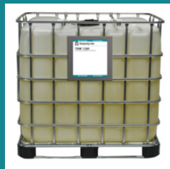
Cuve de 270 gallons (1022 l) SKU: C290-270G UPC-12: 641238082392