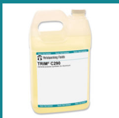
Bidon de 1 gallon (3,8 l) SKU: C290-1G UPC-12: 641238082354