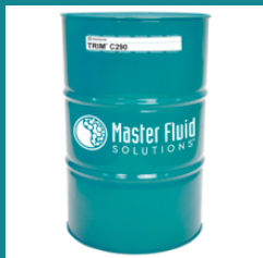
Fût de 54 gallons (204 l) SKU: C290-54G UPC-12: 641238082385