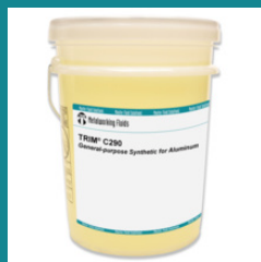
Seau de 5 gallons (19 l) SKU: C290-5G UPC-12: 641238082378