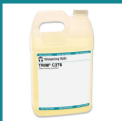
Bidon de 1 gallon (3,8 l) SKU: C276-1G UPC-12: 641238043171