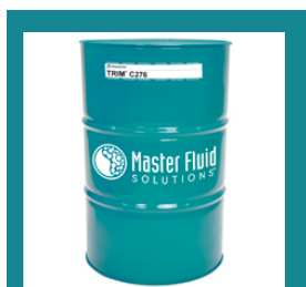
Fût de 54 gallons (204 l) SKU: C276-54G UPC-12: 641238043218