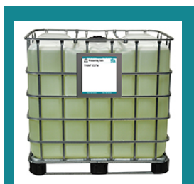
Cuve de 270 gallons (1022 l) SKU: C276-270G UPC-12: 641238043232