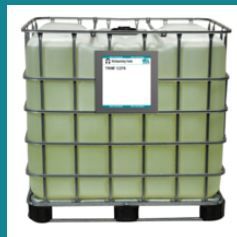
Cuve de 270 gallons (1022 l) SKU: C276-270G UPC-12: 641238043232