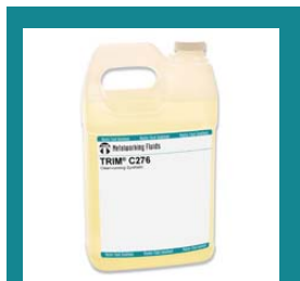
Bidon de 1 gallon (3,8 l) SKU: C276-1G UPC-12: 641238043171