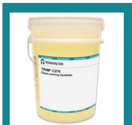
Seau de 5 gallons (19 l) SKU: C276-5G UPC-12: 641238043195