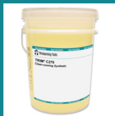
Seau de 5 gallons (19 l) SKU: C276-5G UPC-12: 641238043195