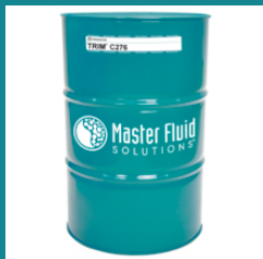
Fût de 54 gallons (204 l) SKU: C276-54G UPC-12: 641238043218